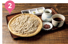
高管食道水神蕎麥麵